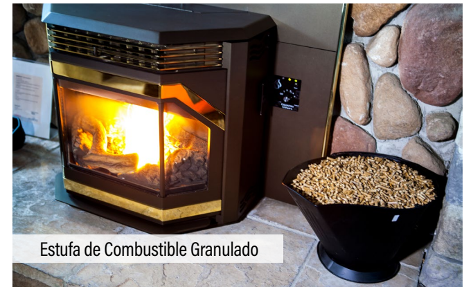
Estufa de Combustible Granulado