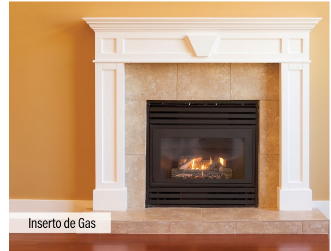
Inserto de Gas

Nunca queme basura, revistas, periódicos, plásticos, desechos de jardín ni otros materiales en ningún aparato de quema, ya sea en el interior o exterior. Hacerlo es ilegal y peligroso.