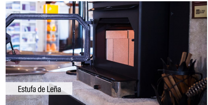
Estufa de Leña